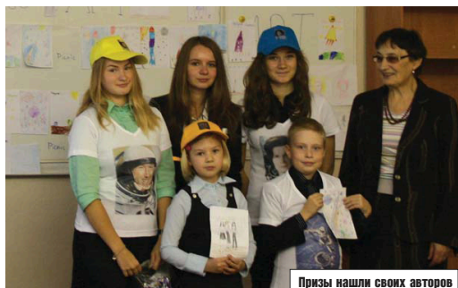
Призы нашли своих авторов

Целью урока было не только познакомить учащихся начальной школы с трудом космонавтов и показать конструкции летательных аппаратов, но и представить интересную коллекцию изделий офисного оформления, посуды в стиле АртКосмос. Это направление в практике работы дизайне-