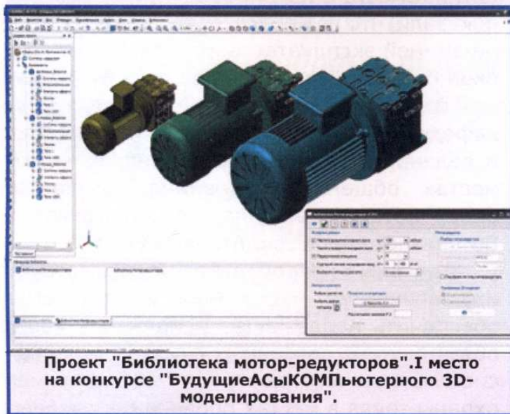
Проект "Библиотека мотор-редукторов". I место на конкурсе "Будущие АСы КОМПьютерного 3D-моделирования".